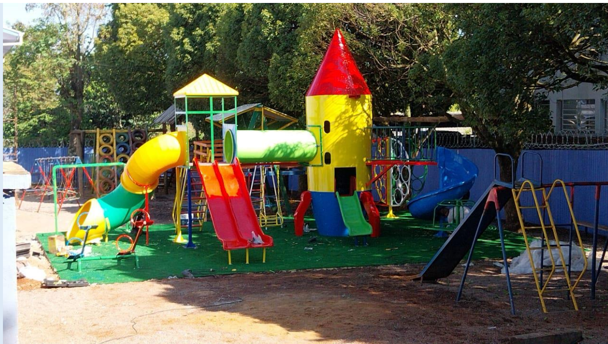
Imagem 03: Foto Ilustrativa do Item 02