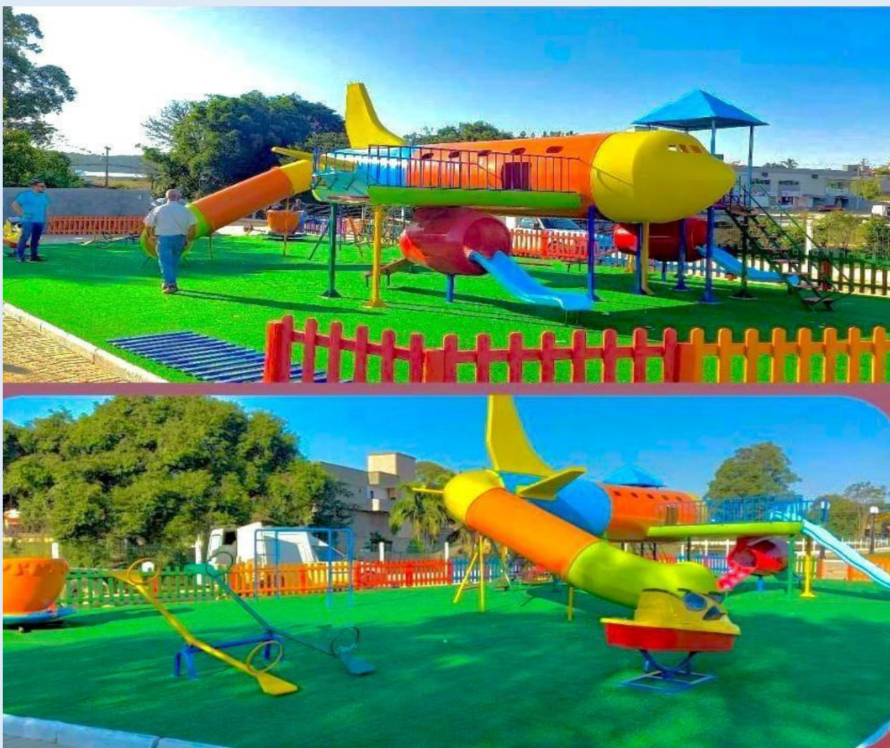
Imagem 01 – Foto Ilustrativa do Item 01