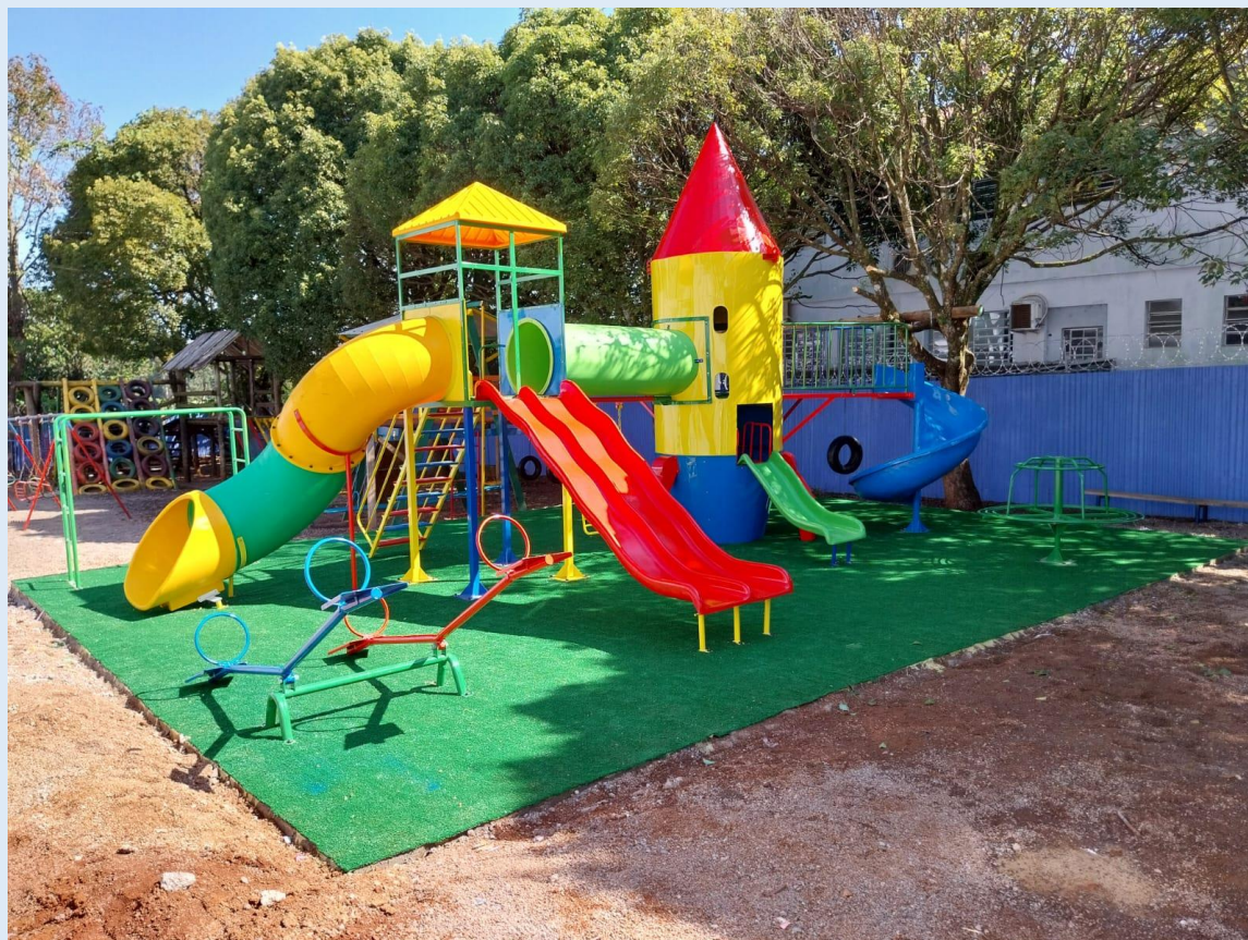
Imagem 04: Foto Ilustrativa do Item 02